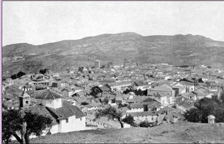
Priego de Córdoba, vista general hacia 1900. Portfolio Fotográfico de España.

Más allá de ese corazón urbano del Subbético central andaluz, otras redes de pequeñas ciudades y núcleos rurales conforman tramas históricas de asentamientos, también marcadas por el hecho fronterizo en su emplazamiento y en su urbanismo originario, poco articuladas entre sí y siempre dependientes de las plazas fuertes que representaron las actuales ciudades medias. A estas tramas de asentamientos históricos pertenecen los pequeños núcleos del Subbético cordobés (Rute, Iznájar, Benamejí...) y en cierto modo también el poblamiento de Mágina o de los Montes de Granada.