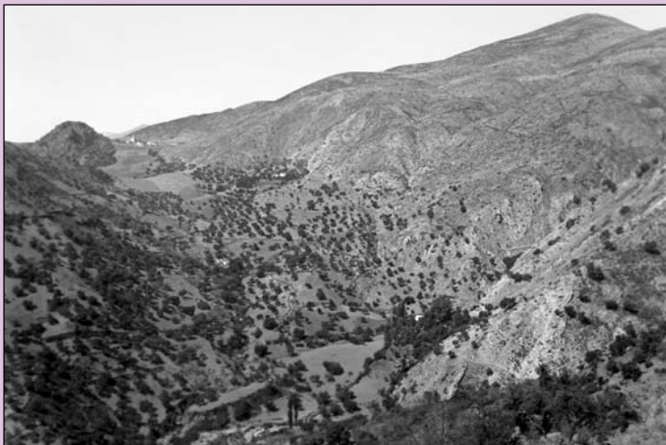
Serranía de Ronda. A principios del siglo XX.