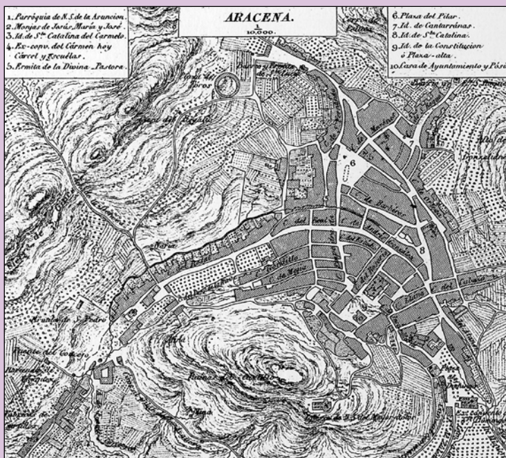
La población de Aracena hacia 1853 según el plan de Francisco de Coello.

En la segunda mitad del siglo XX, la sierra sufrirá decisivos procesos de transformación: la quiebra de un modelo agrario y artesanal orientado en buena parte a la autosuficiencia; la emigración de la población, con el consiguiente despoblamiento y envejecimiento demográfico; la desorganización de los agrosistemas tradicionales, sustituidos en parte por las repoblaciones forestales madereras que transforman, aunque en menor medida que en otros ámbitos de Sierra Morena, los paisajes serranos. Y, también, una creciente manifestación de la impronta turística de la comarca, hasta convertirla en uno de los principales destinos del turismo rural regional.