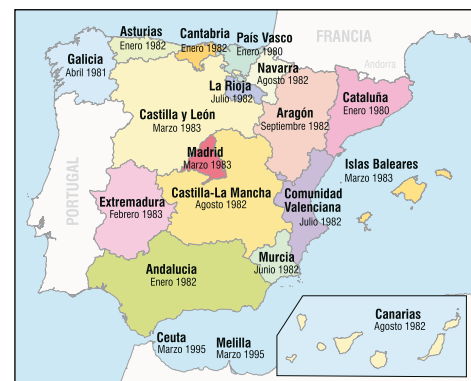
El Estado de las Autonomías

La capitalidad de la Comunidad se establece en Sevilla, donde tienen su sede el Presidente de la Junta de Andalucía, supremo representante de la Comunidad, el Consejo de Gobierno de la Junta de Andalucía, el órgano político y administrativo superior al que corresponde el ejercicio de la potestad reglamentaria y el desempeño de la función ejecutiva, y el Parlamento de An-